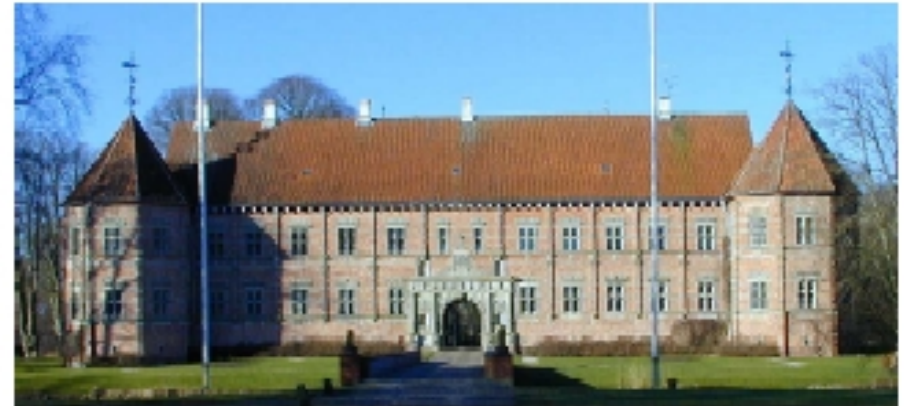
Voergård, Dronninglund herred.

Udgiverselskabet ved Landsarkivet for Nørrejylland 2000